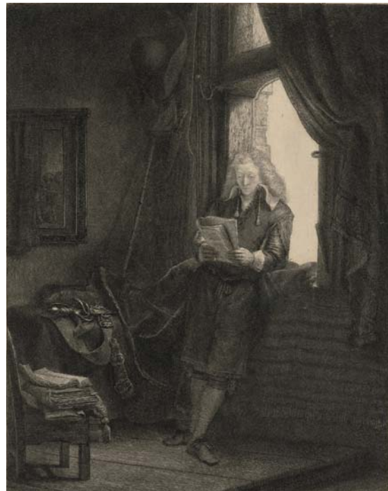
• Rembrandt Harmensz. van Rijn (Leyde 1606 – 1669 Amsterdam), Portrait de Jan Six , 1647, 3 e état, eau-forte, pointe sèche et gravure, 24,6×19,1 cm