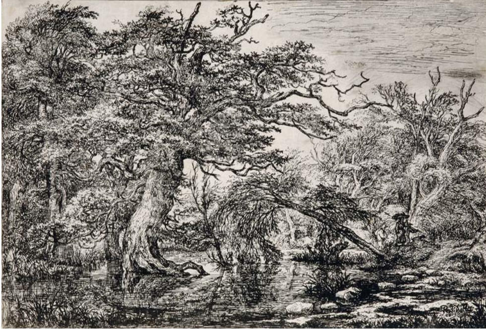
• Jacob van Ruisdael (Haarlem 1628 ou 1629 – 1682 Amsterdam), Voyageurs dans une forêt (« Les voyageurs ») , vers 1650 – 1655, 3 e état, eau-forte et pointe sèche, 18,8×27,4 cm