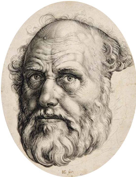
• Hendrick Goltzius (Mühlbracht 1558 – 1617 Haarlem), Portrait de Dirck Volckertsz. Coornhert , vers 1591 – 1592, premier état, gravure au burin, 22,3×17,1 cm