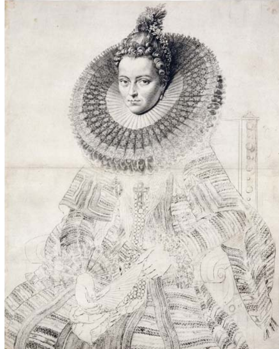
• Jan Harmensz. Muller (Amsterdam 1571 – 1627 Amsterdam) d'après Peter Paul Rubens (Siegen 1577 – 1640 Anvers), Portrait de l'archiduchesse Isabella Clara Eugenia d'Autriche , vers 1615, 1 er état, gravure au burin, corrections à la pierre noire et pinceau et encre brune, 35,7×27 cm