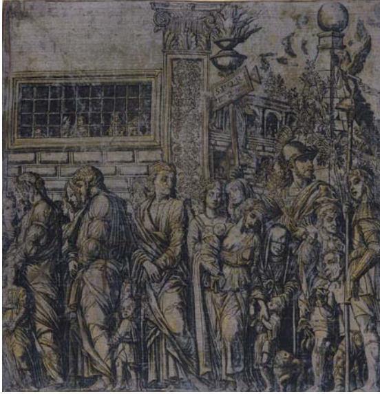
• Andrea Andreani (Mantoue vers 1558/1559 – 1629 Mantoue) d'après Andrea Mantegna (Isola di Cartura? 1430 ou 1431 – 1506 Mantoue), Les prisonniers , septième gravure de la série Le triomphe de Jules César , 1599, gravure sur bois de trois planches, imprimée en noir et deux tons de gris, sur soie violette, rehaussée d'or à la plume, 37,5×37 cm