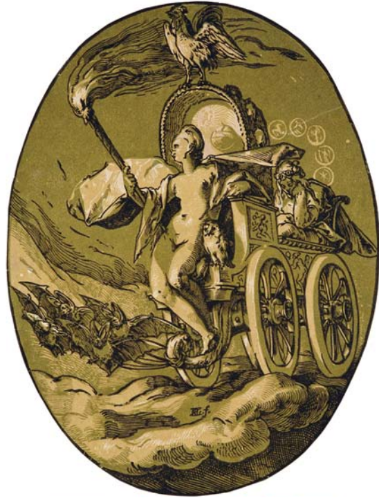
• Hendrick Goltzius (Mühlbracht 1558 - 1617 Haarlem), Nox (la Nuit) , vers 1590, gravure sur bois de trois planches, imprimée en noir, vert-olive et brun jaunâtre, 34,6×26,2 cm (ovale)