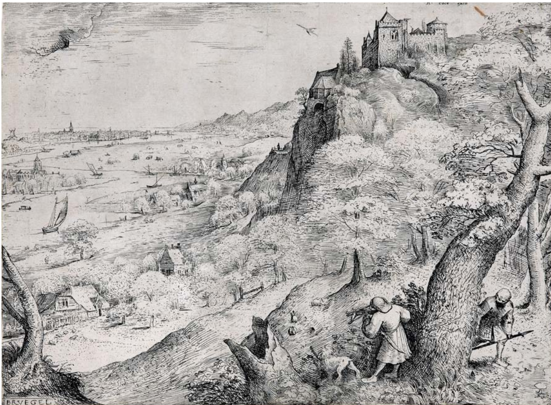
• Pieter Bruegel l'Ancien (Breda? vers 1525 - 1569 Bruxelles), La chasse aux lapins , 1560, eau-forte, 21,5×29 cm