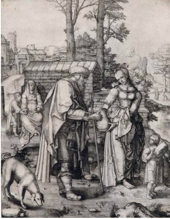
• Lucas de Leyde (Leyde 1494 - 1533 Leyde), Abraham renvoie Agar (la « Grande Agar ») , vers 1506 - 1507, gravure au burin, 27,5×21,4 cm