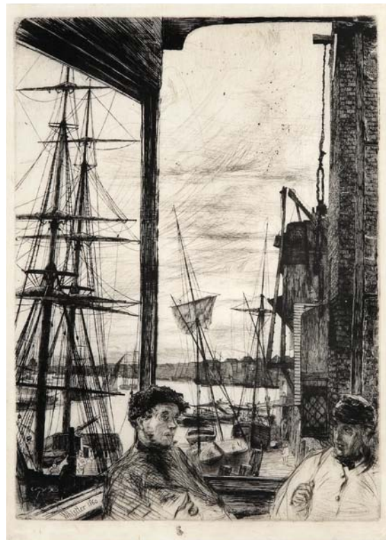
• James Abbott McNeill Whistler (Lowell 1834 – 1903 Londres), Rotherhithe , 1860, 3 e état, eau-forte et pointe sèche sur papier Japon, 27,6×20 cm